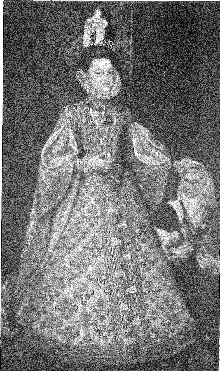
ISABELLE-CLAIRE-EUGÉNIE INFANTE D'ESPAGNE

Portrait de LÉANO. Galerie du Prado, Madrid.