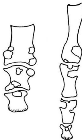
Fig. 2. Lacunes et lésions ostéolytiques au niveau des interphalangiennes digitales

La biologie sanguine montre parfois une augmentation du nombre de leucocytes, de la vitesse de sédimentation érythrocytaire et de la C-reactive protéine (CRP). L'uricémie est fréquemment normale (30 %) pendant les crises aiguës. Le diagnostic définitif de goutte repose sur l'identification directe des cristaux d'urate monosodique dans le liquide synovial et sur l'exclusion