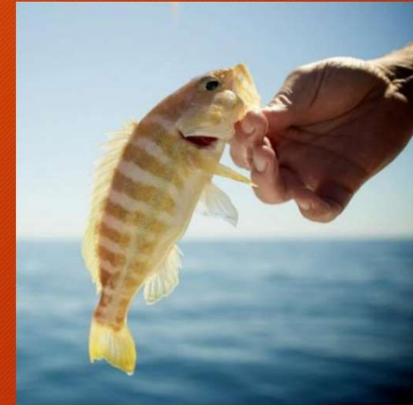
Serran ( Serranus cabrilla ) Recommended by scientists