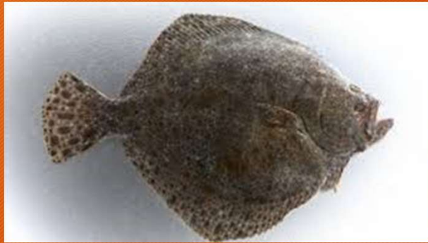
Turbot ( Scophthalmus maximus ) Used in industrialists' monitoring