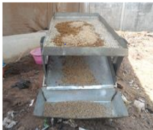
Figure 3 : Extracteur des asticots de mouches domestiques (60).