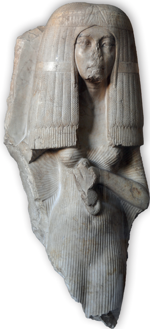
Fig. 2 : statue fragmentaire d'un groupe représentant le général Nakht-min, fils d'Ay, et son épouse, datant du règne de Toutankhamon ou d'Ay (Le Caire CG 779B). On notera la sophistication du rendu sculptural de la texture de la perruque et du vêtement en drapé mouillé de la dame.

« Il y a de bons artisans du bois où tu es. Qu'ils fassent une figure d'animal sauvage, terrestre ou aquatique, d'après nature, de sorte que la peau soit exactement comme celle d'un animal vivant. Que ton messenger me l'apporte! »