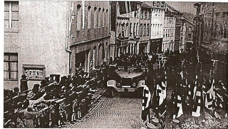
• Drapeaux nazis et saluts hitlériens lors de l'entrée allemande dans les cantons de l'Est en mai 1940.

Le chapitre consacré à l'identité constitue avant tout une tentative – marquée par la sympathie – de décrypter un certain nombre de clichés concernant les Belges germanophones. Wenselaers ne semble pas intéressé par des aspects plus théoriques du concept identitaire. Son résultat est clair : les Belges germanophones ne sont ni des Wallons, ni des Allemands. Il ne traite pas de l'aspect problématique d'une telle identité, basée sur l'opposition à d'autres, ni même du thème du repli identitaire. L'identité des Belges germanophones serait une non-identité, et c'est probablement la raison pour laquelle l'historien se mue à la fin de son exposé en prophète et expose différentes hypothèses relatives