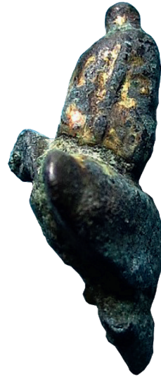
I.AC 67 (3)