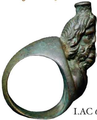
I.AC 69 (2)