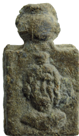
VI.CD 18 (a)