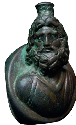
I.AC 69 (1)