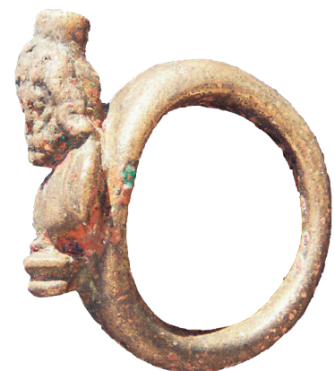
I.G 13 (2)