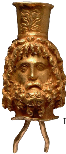
I.AC 68 (1)