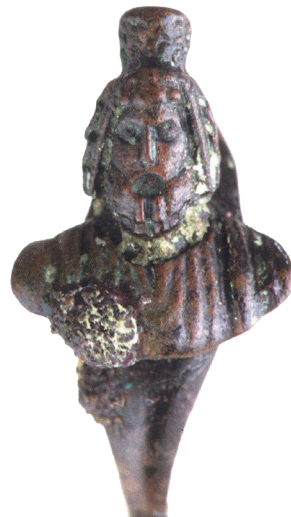
I.AC 66 (1)