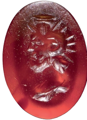
VI.EAA 41 (a)