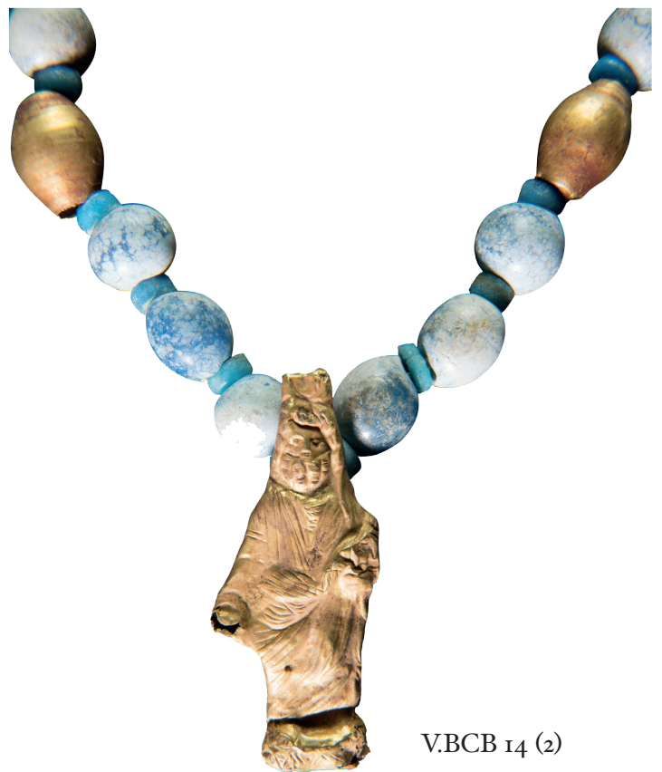
V.BCB 14 (2)