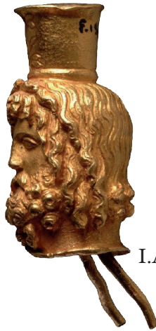
I.AC 68 (2)