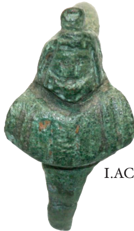
I.AC 70 (1)