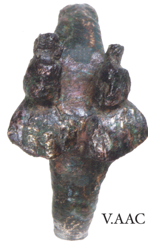
V.AAC 18 (1)