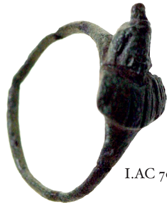
I.AC 70 (2)