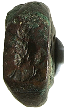
I.AB 438 (2)