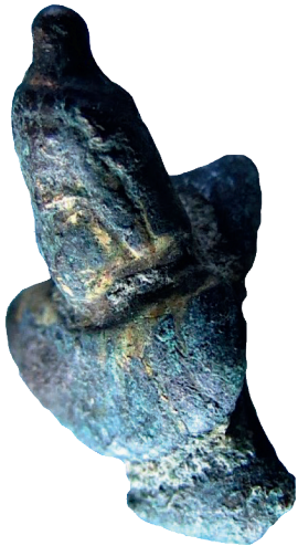
I.AC 67 (1)