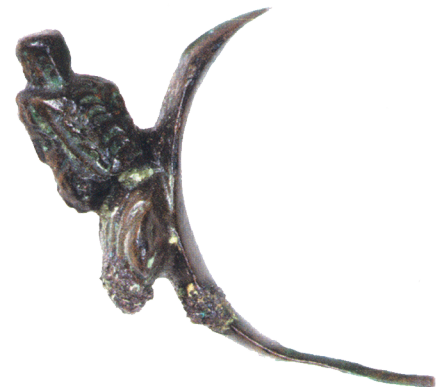
I.AC 66 (2)