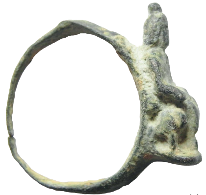
II.AA 30 (2)