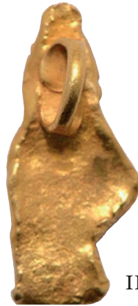
III.D 10 (2)