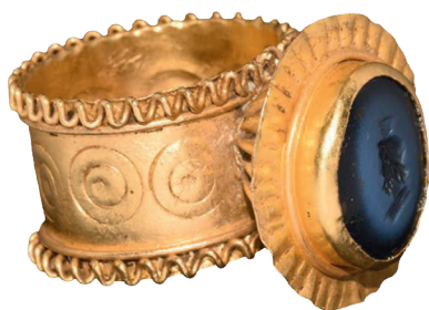
I.AB 427 (1)