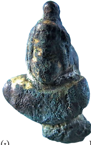
I.AC 67 (2)