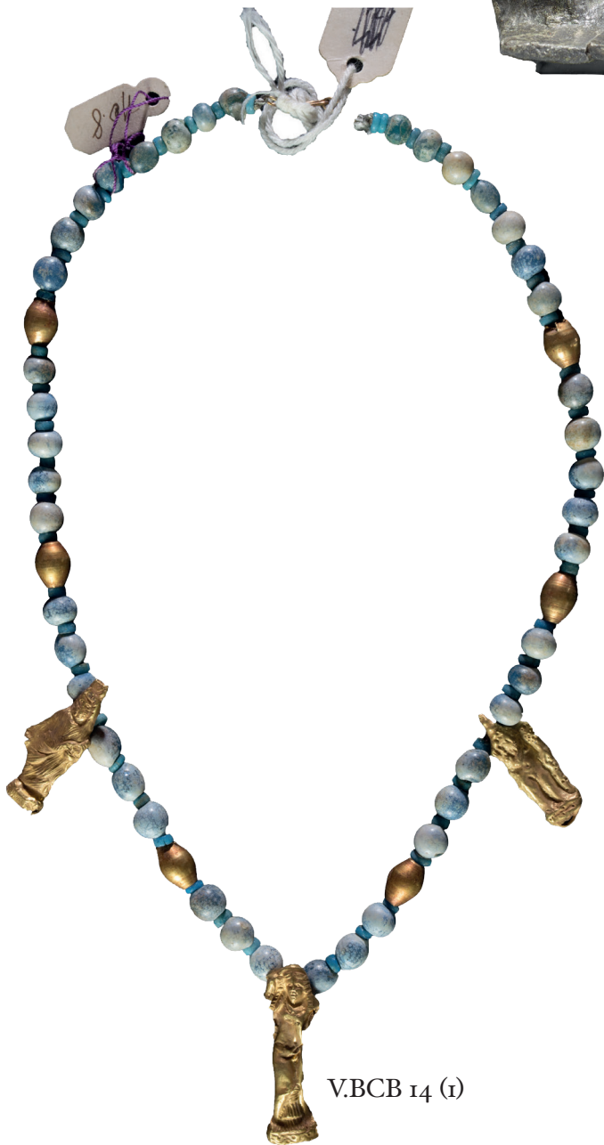
V.BCB 14 (1)