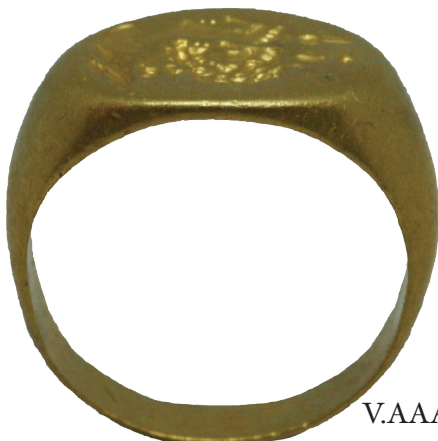
V.AAA 99 (2)