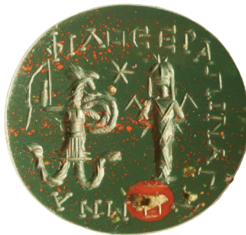
A. 55 (a)