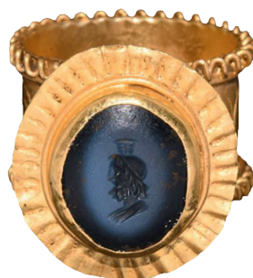
I.AB 427 (2)