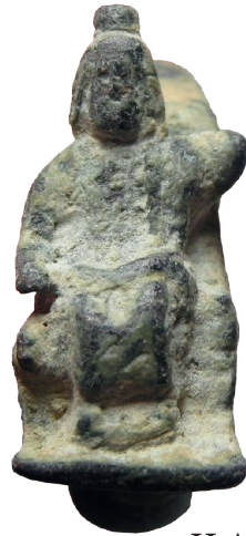
II.AA 30 (1)