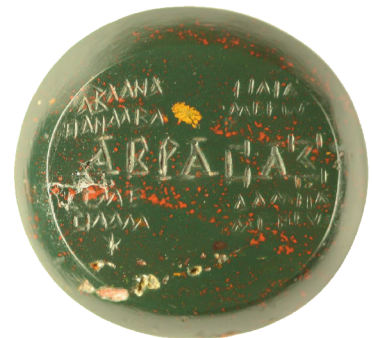
A. 55 (r)