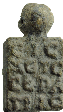
VI.CD 18 (r)