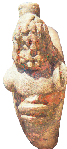
I.G 13 (1)