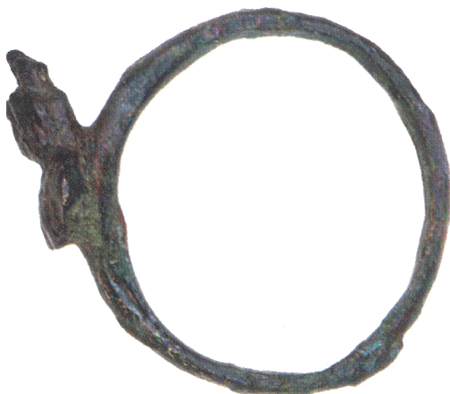
V.AAC 18 (2)