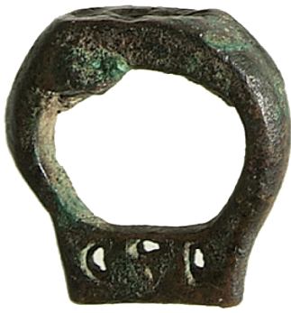
I.AB 438 (1)