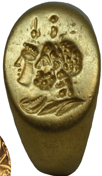
V.AAA 99 (1)