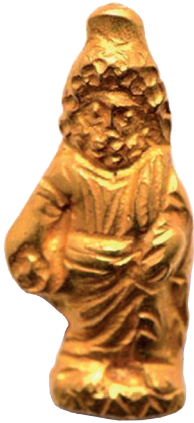
III.D 10 (1)