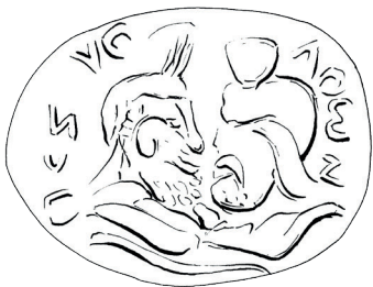
V.AAB 47 (dessin)