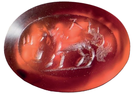
VI.EAA 41 (r)