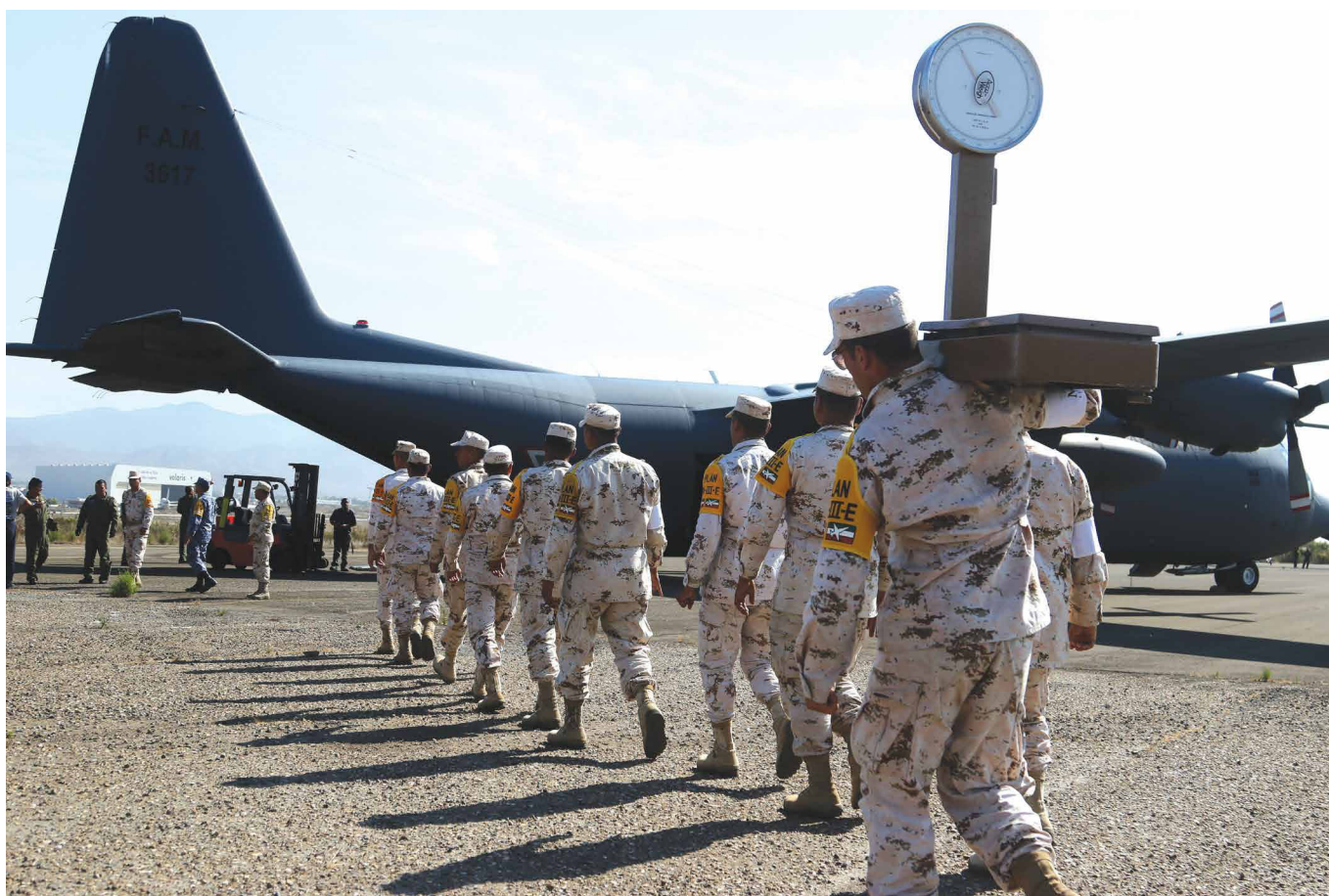
De Tijuana a Oaxaca, la ayuda para damnificados

“LOS EVENTOS DE RECAUDACIÓN DE FONDOS DESDE EL EXTERIOR DEL TERRITORIO NACIONAL DEMUESTRAN LA SOLIDARIDAD DE LOS MIGRANTES MEXICANOS CON SU PUEBLO Y SU AGILIDAD PARA MOVILIZAR TODOS LOS RECURSOS A SU DISPOSICIÓN...”