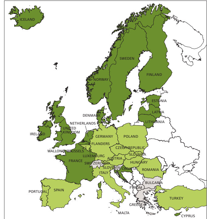
Official documents on architectural policy

■ Have a document ■ Planning to have ■ Not planning to have