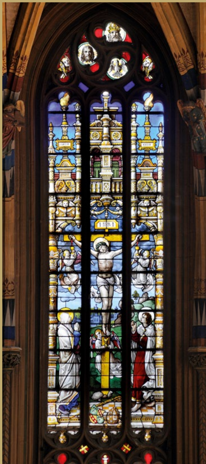
Fig. 97. Vitrail du chœur commandé par Jean de Cromois.