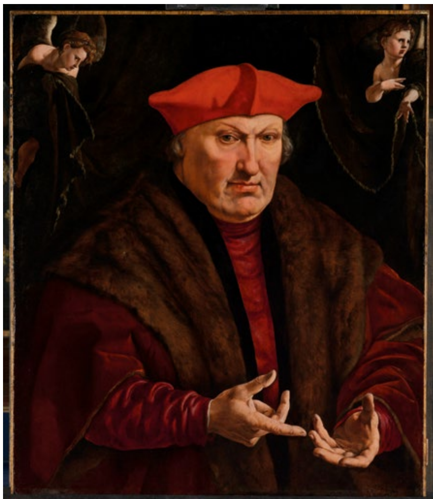
Fig. 96. Portrait d'Érarde de La Marck (1472-1538), Jan Cornelisz Vermeyen, ca 1528-1530, huile sur panneau, 64,4 × 55,5 cm, Amsterdam, Rijksmuseum.

dite « de Saint-Jacques », le 3 juillet 1487 483 . Cet ouvrage législatif visait à actualiser le droit public et administratif liégeois. La commission chargée de ce travail siégea trois semaines à Saint-Jacques, au plus près des archives communales qui y étaient traditionnellement entreposées. Au terme de ses travaux, la commission livra un texte de vingt-huit chapitres. Un grand nombre d'entre eux concernaient la réforme des tribunaux ecclésiastiques, limitant notamment les possibilités que ceux-ci avaient de prononcer des peines graves, et leur imposant de connaître les trois langues du droit ayant cours dans le pays (français, thiois, latin). D'autres points précisaient et amendaient les droits du tribunal des échevins et même du tribunal de l'Anneau du palais – le tribunal du prince. Le texte fixait également l'élection des deux bourgmestres de la