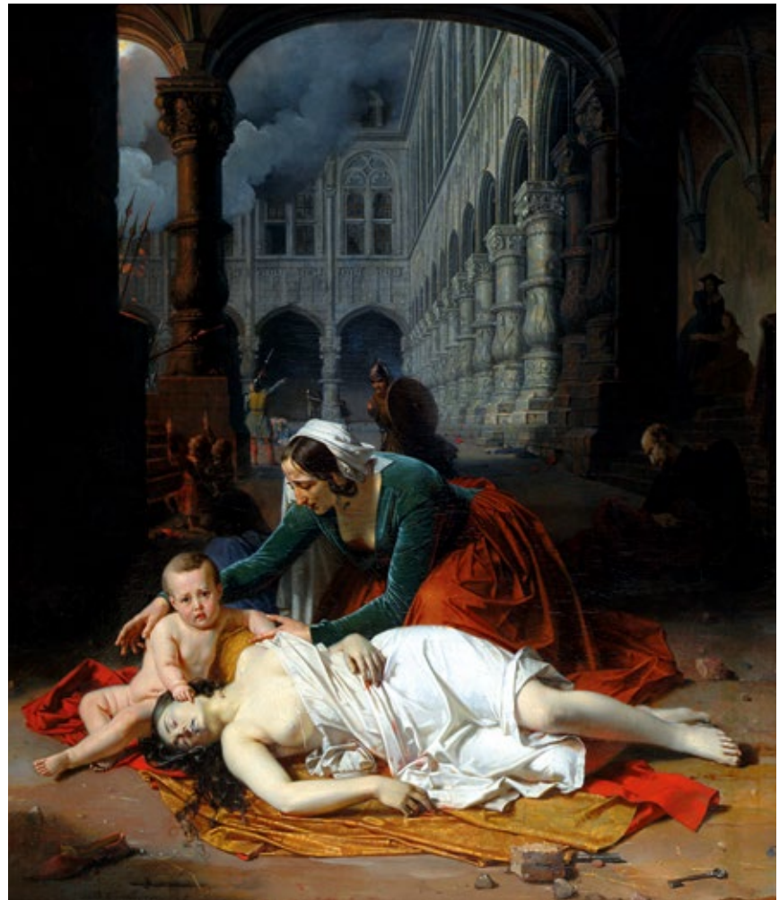
Fig. 95. Un épisode du sac de Charles le Téméraire en 1468, Barthélemy Vieillevoye. 1842, Liège, Musée Curtius, huile sur panneau.