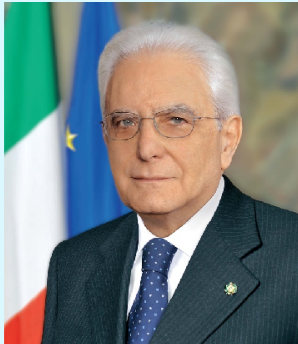
Sergio Mattarella, Presidente desde 2015