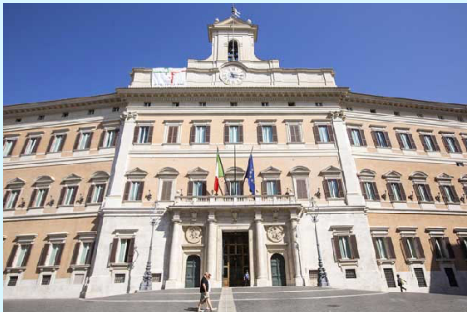
Palazzo Montecitorio, sede de la Camara de los Diputados