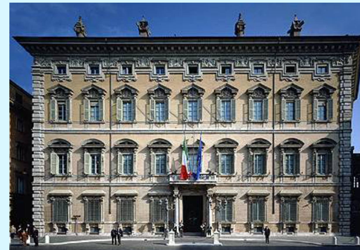
Palazzo madama, sede del Senado