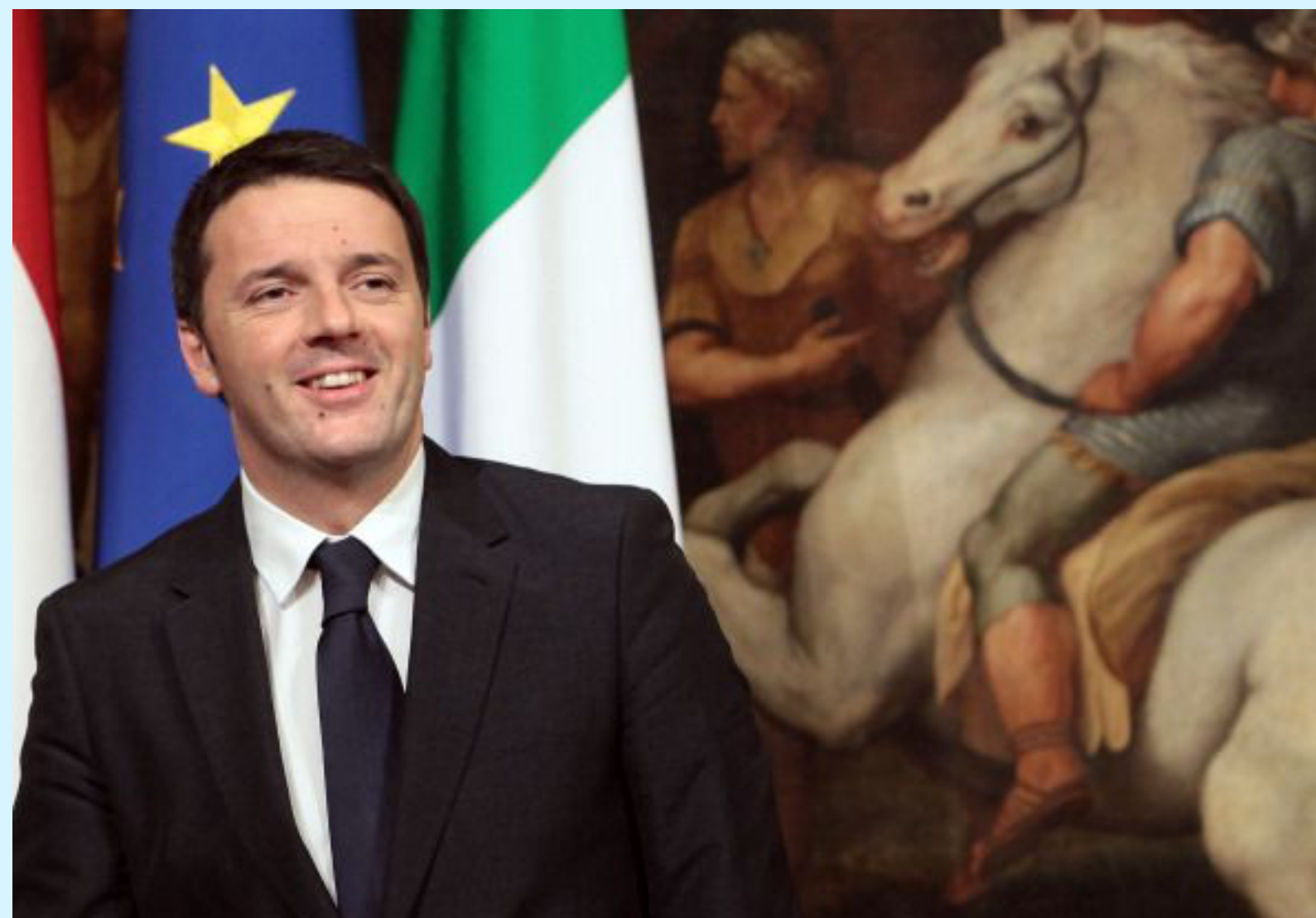
Matteo Renzi, Jefe de Gobierno desde 2014