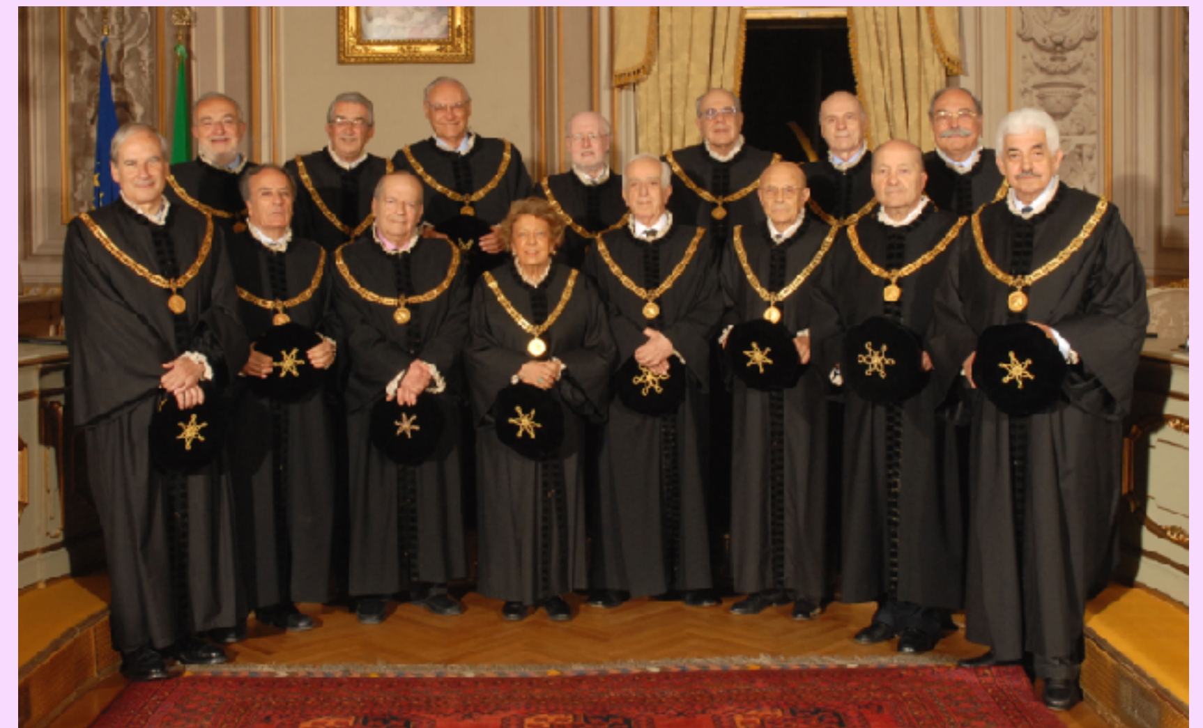
Los jueces de la Corte Constitucional Italiana