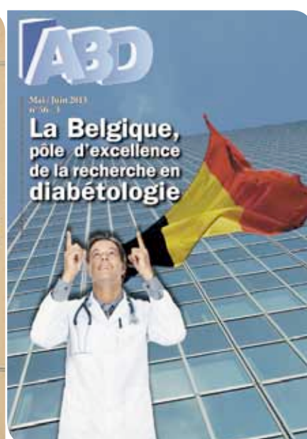
Le premier numéro de la revue ABD en juin 1958 et celui paru 55 ans plus tard, en mai-juin 2013