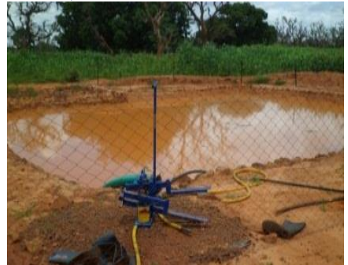
Bassin avec l'eau