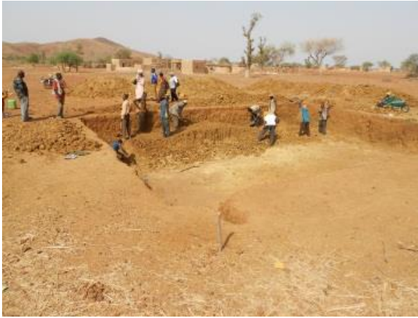
Excavation du bassin