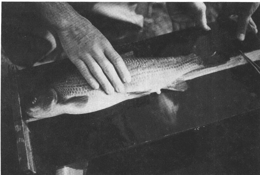
Photo 1. Un spécimen de hotu mâle ( Chondrostomas nasus ) capturé lors d'une pêche à l'électricité dans l'Ourthe.

Le hotu ( Chondrostomas nasus ) (photo 1) est un poisson Cyprinidé présent dans les parties moyennes et basses de la plupart des rivières du bassin de la Meuse. Sa biologie a déjà fait l'objet d'études en milieu naturel et spécialement dans l'Ourthe (PHILIPPART, 1981). Depuis quelques dizaines d'années, on note toutefois une régression sensible des populations wallonnes de hotu. Celle-ci résulte de plusieurs facteurs : i) altération des frayères (PHILIPPART et VRANKEN, 1983), ii) sensibilité à certains types de pollution (désoxygénation, métaux lourds, organochlorés), iii) exploitation halieutique excessive (parfois la destruction systématique) dont a été jadis victime ce poisson non indigène (originaire du bassin du Danube).