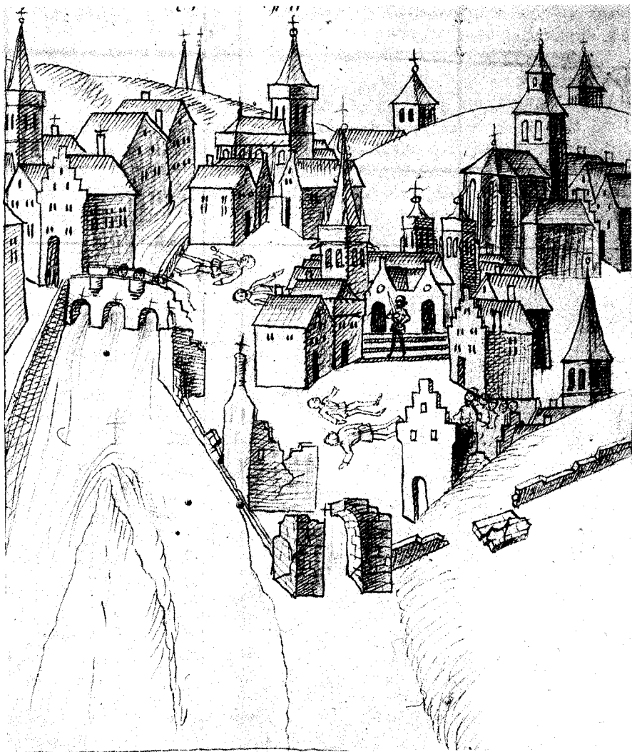
Liège après le sac de 1468, NICOLAS CLOPPER, Florarium Temporum , Düsseldorf, Nordrh.-Westf. Hauptstaats-Archiv, ms. C X Nr. 2, f° 322 v°, dessin à la plume.