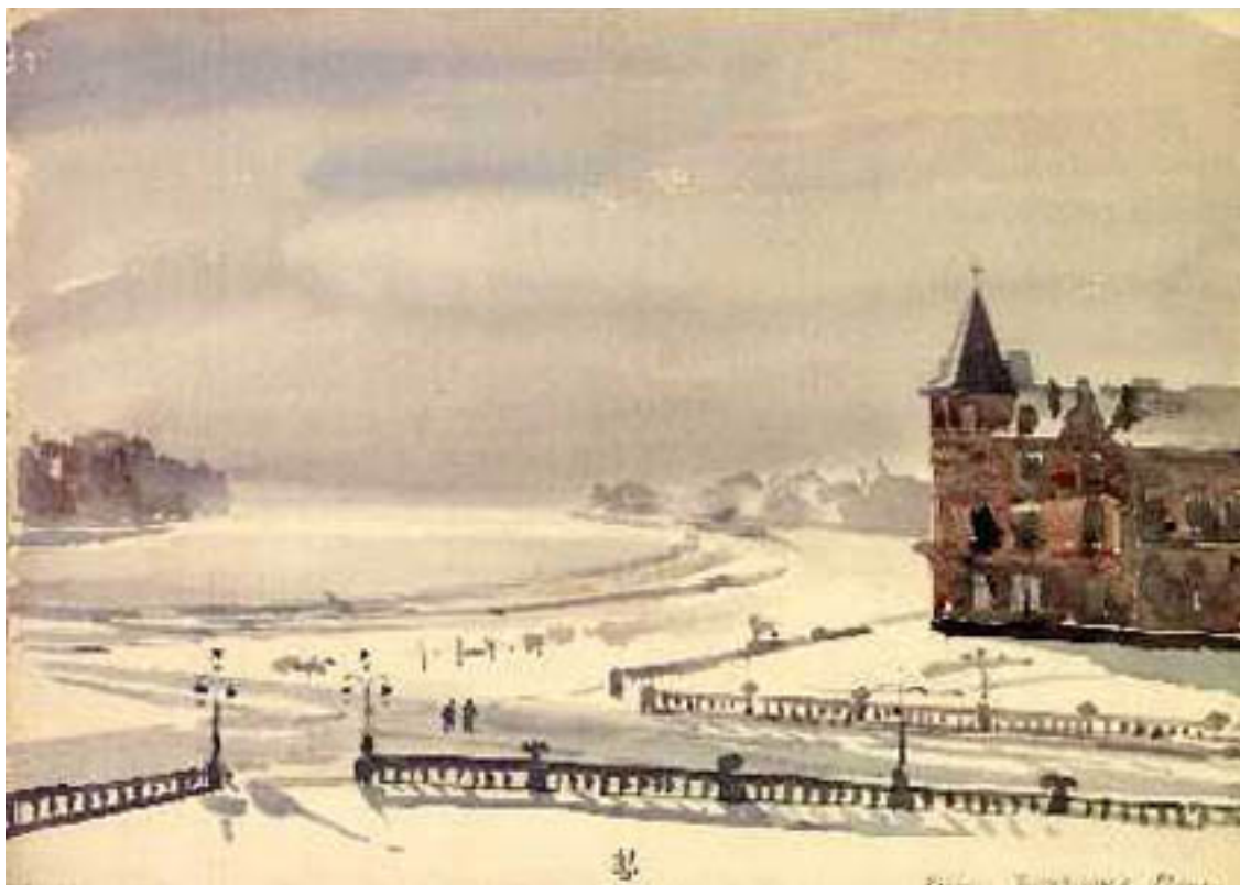
Léon Fredericq, Heyst, aquarelle, 24 x 16 cm, 1893. - Léon Fredericq, Les Terrasses sous la neige