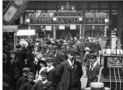
Whitsuntide Fair at Preston, Mitchell & Kenyon, 1906.