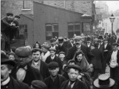
Messrs Lumb and Co. Leaving the Works, Huddersfield, Mitchell & Kenyon, 1900.

Pour aborder cette vaste problématique, la présente réflexion s'articulera, non pas autour de trois films, mais, plus modestement, autour de trois moments d'image , voire de trois moments de flottement dans les images, puisés dans des films datant de ces années-là.