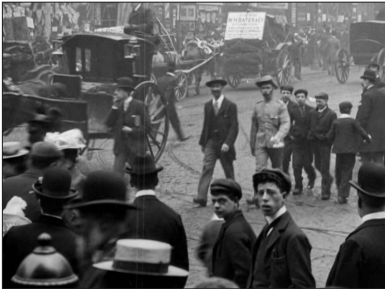
Manchester Street Scene, Mitchell & Kenyon, 1901.