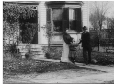
Edwin S. Porter, The Ex-Convict , Edison, 1904. Carton-titre et premier plan.