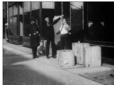
Edwin S. Porter, The Ex-Convict , Edison, 1904. La dénonciation et le plan correspondant.

Dans le plan correspondant, l'opérateur de prise de vue a investi un espace public, c'est-à-dire l'espace même dont les scènes de rue et autres