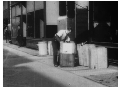
Edwin S. Porter, The Ex-Convict , Edison, 1904. Des corps étrangers à l'arrière-plan et le corps en jeu à l'avant-plan.

De manière très manifeste, ces trois corps-là, à l'opposé de ceux qui occupent l'avant-plan, ne sont pas des corps en jeu ou des corps de fiction. Ce sont des corps étrangers à la scène en train de se tourner. En tant que tels, ils contribuent involontairement à désigner les autres corps comme personnages et, par conséquent, comme héros potentiels. En pareille image, corps de fiction et corps étrangers, héros et antihéros coexistent, à l'intérieur d'un espace mélangé ou hybride.