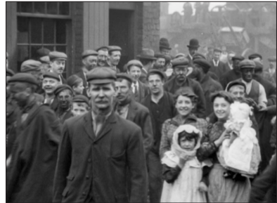
Pendlebury Colliery, Mitchell & Kenyon, 1901.