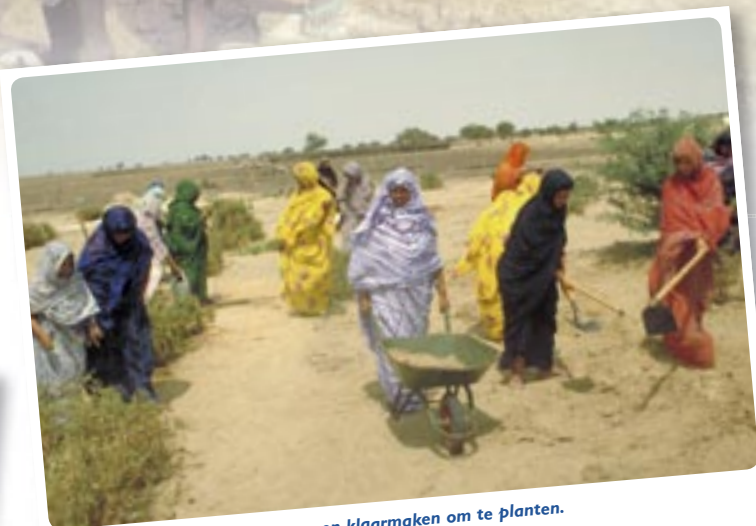
... en klaarmaken om te planten.