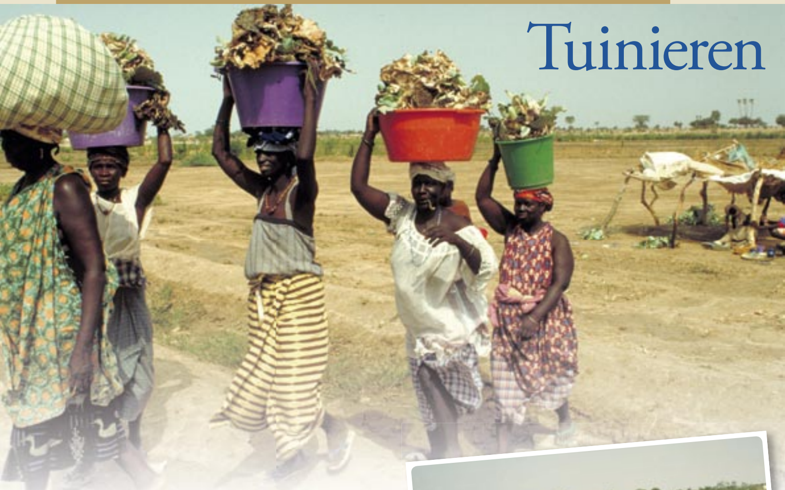
Tuinbouwcoöperatieve van vrouwen in Mauritanië. Overbegrazing, ontbossing, bodemerosie, droogte en zandstormen werken de uitbreiding van de Sahara in de hand.