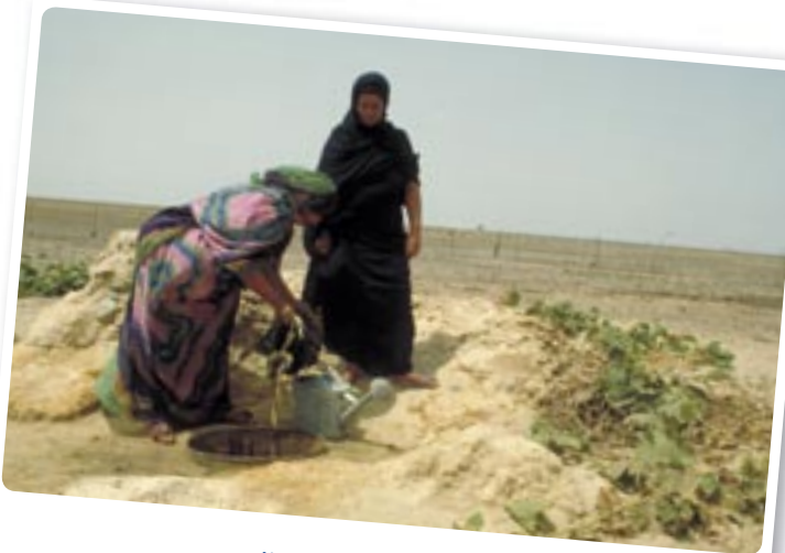
Water halen uit een put ...