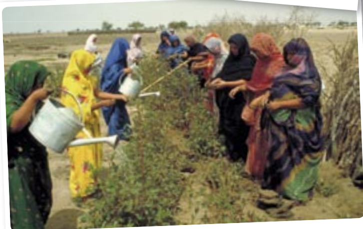
...om de tuin te besproeien.