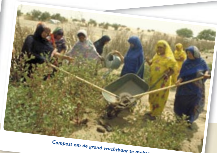
Compost om de grond vruchtbaar te maken.