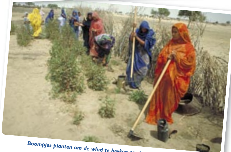
Boompjes planten om de wind te breken en de tuin te beschermen.