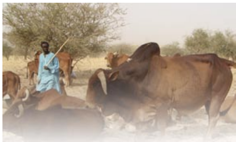
Voor de verbetering en verhoging van de productie van vlees en melk, en dus van de voedselzekerheid, steunt de Belgische ontwikkelings-samenwerking in Mali en Niger een project voor de selectie en verspreiding van de Azawak-zeboe, een typisch runderras uit de regio.

Via de verschillende samenwerkingskanalen draagt een groot deel van de interventies op het vlak van plattelandsontwikkeling, integraal beheer van de waterrijkdommen, promotie van agrobosbouw en