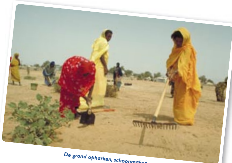
De grond opharken, schoonmaken ...