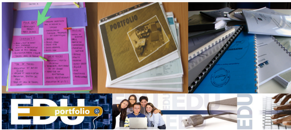
Figure 1. Sous format papier ou électronique, le portfolio peut prendre un aspect plus créatif ou plus académique

collaboration a été signé entre deux acteurs du monde de l'eLearning 1 . Cet accord prévoit la standardisation des portfolios électroniques, de façon à ce que de mêmes protocoles régissent leurs développements futurs, tant dans le monde de l'éducation que dans ceux du travail et de la formation continuée.