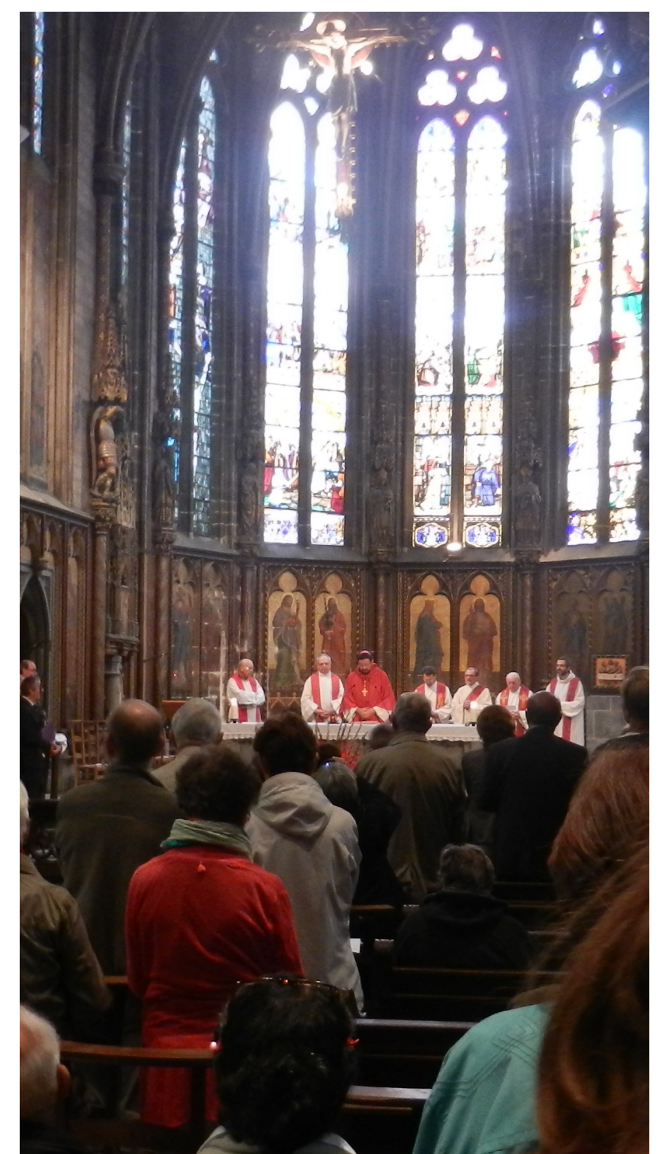
Messe à l'occasion de la fête de la Croix Glorieuse célébrée par Mgr Jean-Pierre Delville le 14 septembre 2014.

Dans les années 1950, à Sainte-Croix, les offices accueillaient encore régulièrement jusqu'à six cents personnes. Mais, dans le tournant des années 1970, le quartier a été éventré pour permettre à l'automobile d'arriver au centre-ville et, en 2009, il n'y avait plus qu'une vingtaine de fidèles pour hanter ce lieu de culte majeur. En pareilles circonstances, on pourrait imaginer qu'il suffit de demander aux fidèles du quartier voisin d'abandonner leur église au profit d'une autre, au caractère patrimonial reconnu, mais, en ville, on fréquente une église – on l'habite ensemble? – pour des raisons que ne reconnaissent pas forcément les historiens de l'art, des raisons d'entre soi, de projet commun. Depuis la fin du workshop , un nouveau projet a surgi dont l'Evêque s'est fait le porte-parole : faire de Sainte-Croix une église œcuménique. Une piste qui entre en résonance avec nos sociétés multiculturelles.