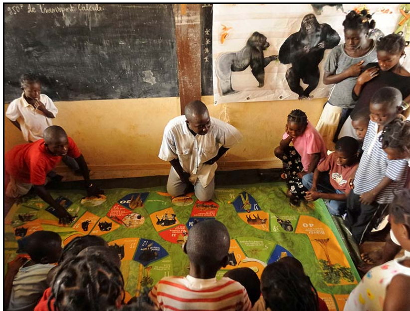
Jeu de l'oie géant sur la vie des grands singes.