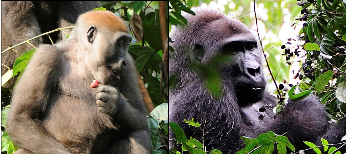
Les gorilles de plaine consomment plus de 100 espèces de fruits.