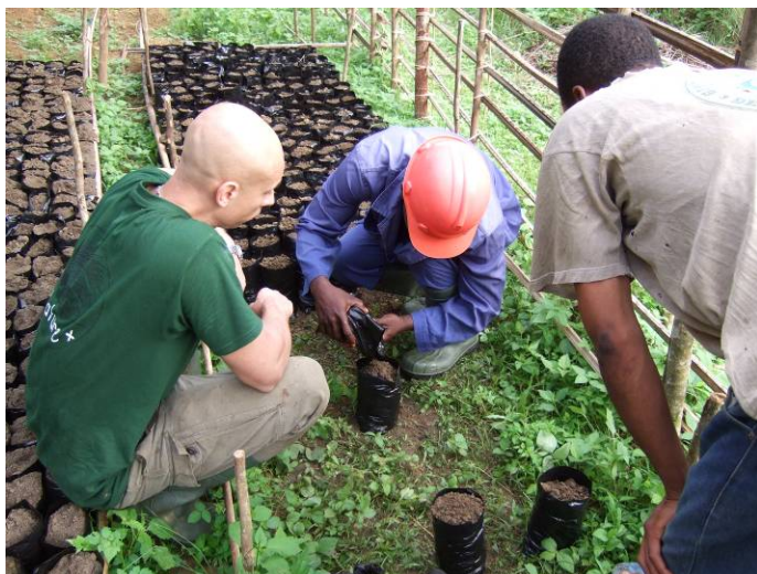
Pépinière villageoise : état des lieux et formation du personnel

Fin 2009, le circuit de suivi de la croissance installé dans les UFA de Ma'an comptait 705 arbres (soit un taux d'accomplissement de 50 %), appartenant aux espèces-cibles suivantes : azobé, bibolo, dabéma, movingui, padouk rouge, okan et talis. Une première campagne de mesure partielle a été menée en mai 2009. Par contre, dans l'UFA 11.005 où les activités ont commencé en septembre, le circuit de suivi de la croissance ne compte que 75 arbres appartenant aux espèces-cibles suivantes : acajous, azobé, framiré, movingui, okan, padouk rouge et tali.