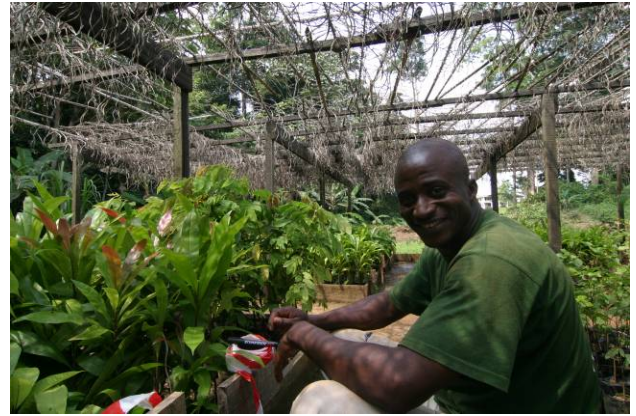
Une pépinière performante