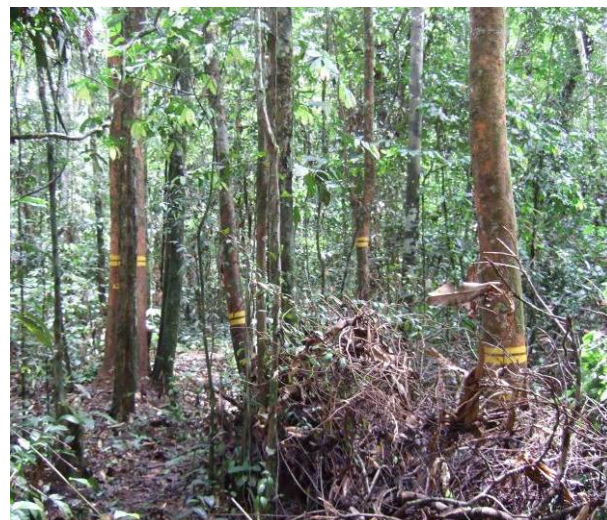
Aperçu de jeunes tiges d'azobé intégrées dans le circuit de suivi de la croissance

En ce qui concerne l'identification des zones à placer en série de conservation dans les UFAs 09.021, 09.024 et 11.005, JL. Doucet a rédigé des études spécifiques analysant l'intérêt et la représentativité des forêts placées en série de conservation 17,18 .