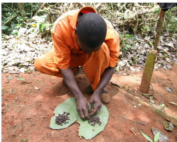
Récolte et tri des graines de Tali

Des rapports de mission détaillant les résultats atteints sont disponibles 10, 11 .