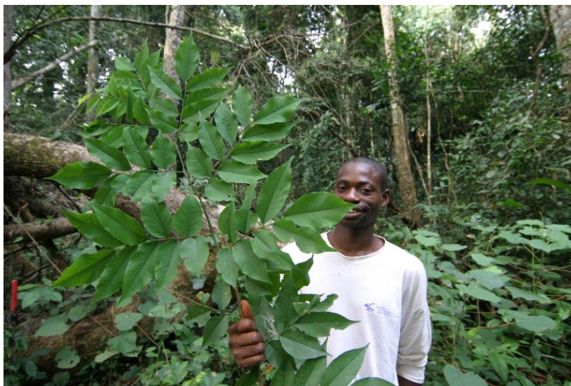
Assaméla dans une trouée d'abattage