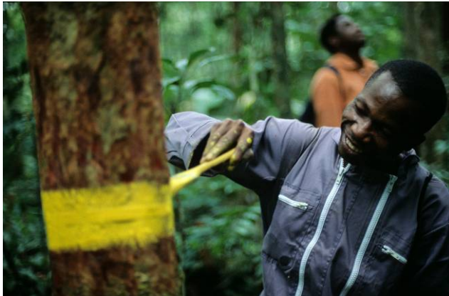
Installation du circuit de croissance

Le rapport technique annuel 1 détaille davantage les interventions et activités menées en 2009. Soulignons que cinq missions ont été menées en 2009 : deux missions d'une semaine par le Prof. JL. Doucet pour la supervision générale des activités 2 , une mission de deux semaines du Dr. Olivier Hardy (ULB) consacrée à l'étude du movingui et deux missions du doctorant Christian Moupela (totalisant environ 3 mois) relative au noisetier du Gabon.