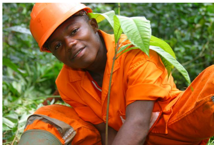
Reboisement dans une trouée d'abattage

En synthèse, près de 10.000 graines ont été semées en 2009 12 . A l'exception du padouk et de l'ayous, toutes les espèces prioritaires du programme ont pu être collectées. Fin juin 2009, la pépinière comptait près de 9.000 plants.