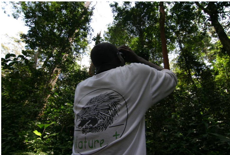
Observation à la jumelle sur le circuit de suivi phénologique

En janvier 2006, cette collaboration a été formalisée par la signature d'une convention dite « FORTROP ». Etablie pour une durée de cinq ans, elle prévoit la mise à disposition d'une expertise permanente sur les dispositifs sylvicoles ainsi que la formation du personnel. L'objectif à terme est de contribuer à la gestion durable des populations d'espèces commerciales importantes pour la Pallisco.