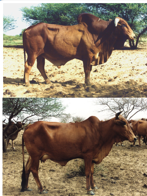
Figure 1: Zébus Azawak améliorés, mâle et femelle