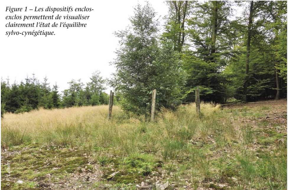
Figure 1 – Les dispositifs enclos-exclos permettent de visualiser clairement l'état de l'équilibre sylvo-cynégétique.

dance des cervidés sur la régénération forestière 6 . Depuis lors, leur utilisation s'est fortement développée, tant au niveau de la recherche scientifique qu'au niveau de la gestion proprement dite.