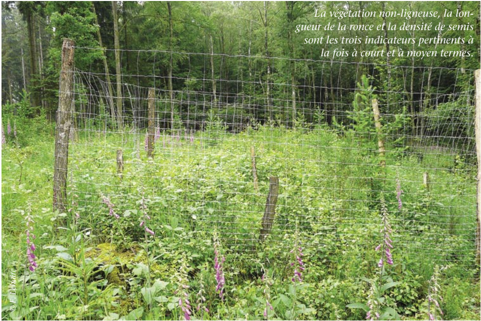
La végétation non-ligneuse, la longueur de la ronce et la densité de semis sont les trois indicateurs pertinents à la fois à court et à moyen termes.

publications, est dû à la croissance de la végétation ligneuse, qui reste un processus relativement lent.