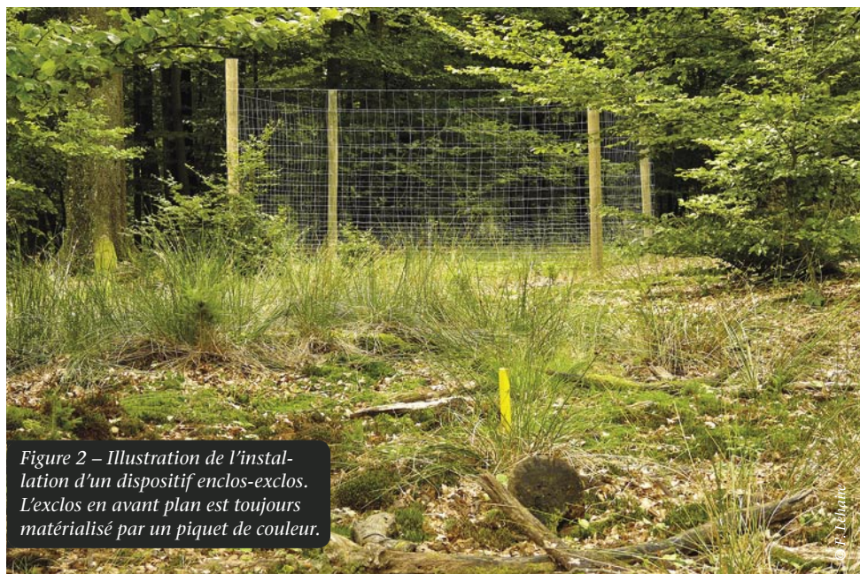
Figure 2 – Illustration de l'installation d'un dispositif enclos-exclos. L'exclos en avant plan est toujours matérialisé par un piquet de couleur.

Le principal intérêt des dispositifs enclos-exclos est leur aspect didactique. C'est pourquoi, un dossier photos doit être mis en place dès leur installation pour per-