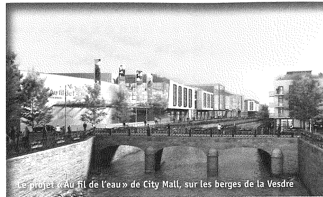
Le projet « Au fil de l'eau » de City Mall, sur les berges de la Vesdre