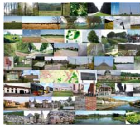
Les objets qui font paysage...