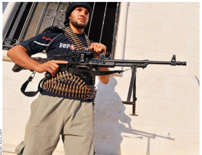
Un membre du groupe jihadiste Hamza Abdualmutilib lors d'un camp d'entraînement du côté d'Alep.

Sources : Le Point, Le Monde, the New York Times, The Daily Telegraph, the Guardian, the Washington Post, BBC, AFP, Reuters, Canal +, Forbes. El Watan. Der Spiegel