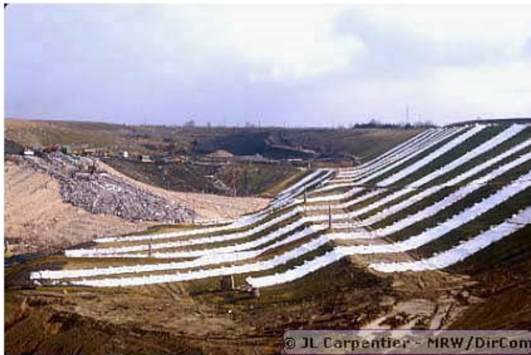
Centre d'enfouissement technique

Plus rarement, c'est l'intensité de l'odeur qui est mesurée. Alors que la concentration de l'odeur est déterminée par le nombre de fois qu'il faut diluer l'échantillon odorant pour atteindre le seuil de perception, l'intensité, elle, est mesurée, en général par un jury d'experts, selon une échelle de sensation subjective (par exemple une échelle à 8 niveaux) pour une odeur donnée et en un endroit donné sur le terrain. Le jury doit évaluer l'équivalence entre l'odeur perçue sur le terrain et celle correspondant à une dilution de n-butanol dans une fiole à large ouverture. Il existe bien entendu une relation entre la notion d'intensité et celle de concentration. La manière dont l'intensité augmente avec la concentration détermine la persistance de l'odeur. Si la pente de variation est faible, l'intensité de l'odeur diminue peu à chaque dilution supplémentaire de l'échantillon : l'odeur est alors dite persistante.