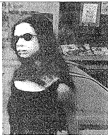
MONA NE SOURIT PLUS...

"Mona ne sourit plus" : sérigraphie (53x110 cm) de Thierry Wesel. L'artiste, qui a exposé dernièrement à la Galerie Wittert, a fait don de quinze de ses œuvres aux Collections artistiques de l'ULg.